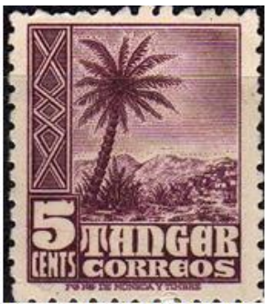
Tanger 1949 - de onbuigzame taaie dadelpalm betekent Tamars naam