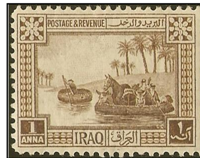
Irak 1923 - Guf(f)a met boten op de Tigris

In de reeks bijzondere vrouwen in de Bijbel is het deze keer de beurt aan een vrouw met de naam die begint met de letter W. Er is geen vrouw gevonden wier naam begint met de letter U. Daarom is het nu de beurt aan weer een schitterende vrouw, die de naam met de beginletter 'V' ofwel 'W' draagt: Vasti ofwel Wasti. Ze wordt genoemd in